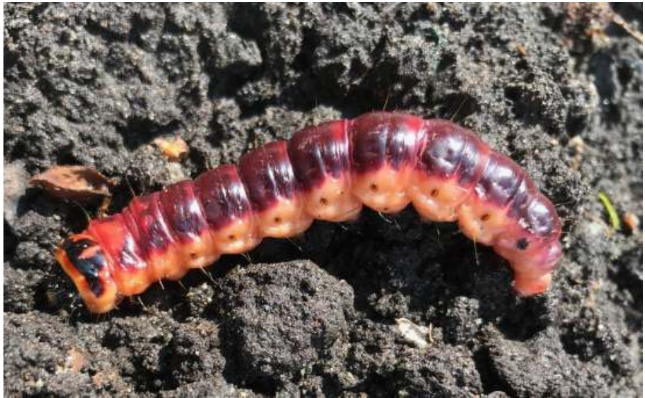
Aangetroffen op M24: wandelende Wilgenhoutrups, 10cm lang, vingerdik. 9 mei.

Zonder dat ik er iets van merkte, heeft Winterkoning een nest onder de dakrand van mijn tuinhuisje gebouwd. Het ligt verscholen tussen de bladeren en takken van de klimhortensia. Dat komt, hij gaat heel tersluiks te werk: vliegt een paar meter terzijde van het nest in het struweel en gaat dan binnendoor naar de bouwplaats. Een ingenieus gebouw, bolvormig nestje. En hij maakt er niet een, maar meerdere. In afwachting welke door de winterkoningin wordt uitverkoren. Gelukkig is dat dus die in mijn tuin. Ik kijk met plezier naar het brengen van kleine insecten naar de winterprinsesjes en -prinsjes.