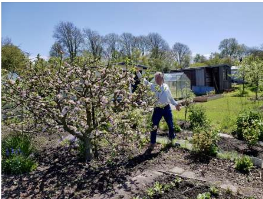
"Houd je boom in toom!"