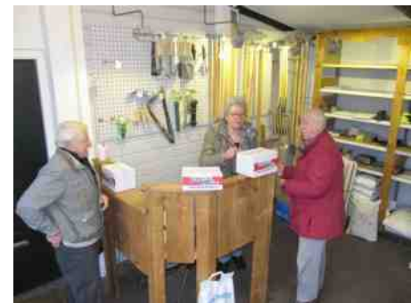
Tous heeft het maar druk aan haar balie. Het is pas begin februari maar menig tuinder zou nu al willen beginnen.