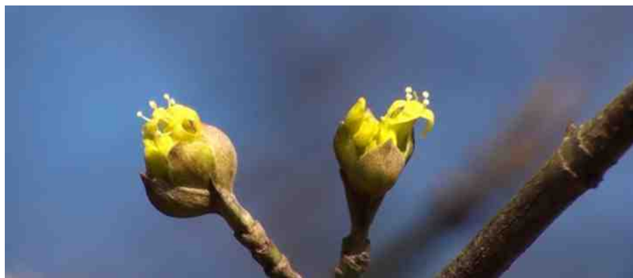
Gele kornoelje, cornus mas 8 jan 2016