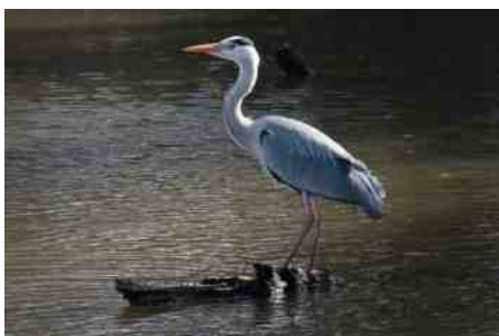
Blauwe reiger kwam deze winter niets te kort.