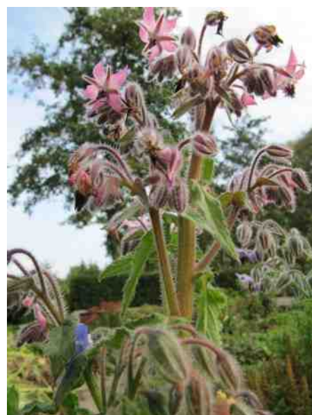
Komkommerkruid heeft meestal blauwe bloemen