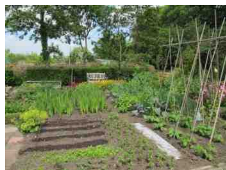
Het seizoen gaat weer beginnen! Maak ook eens een foto voor in de Tuinfluiter!