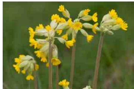
Primula of sleutelbloem