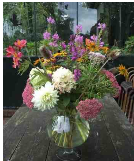
Eén van de fraaie boeketten die Sjoeke eind-zomer maakte ter opfleuring van de kantine.