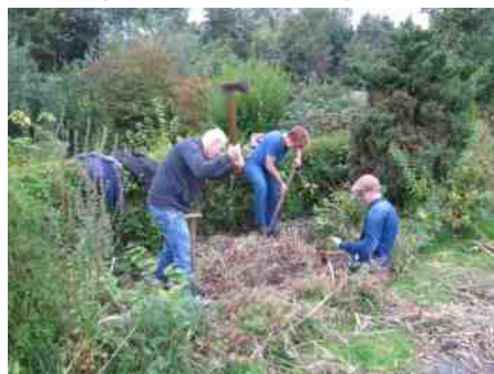
Alg. Werk in gevecht met woekerende bamboe