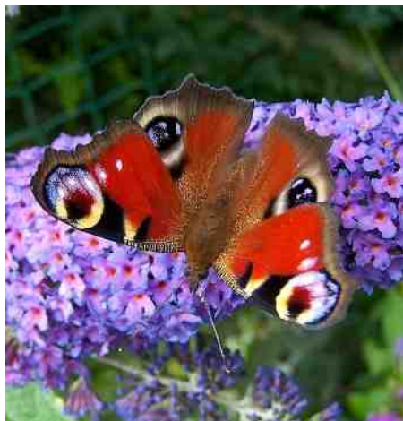
Dagpauwoog op Buddleja

Maartse wind en aprilse regen beloven voor mei grote zegen.