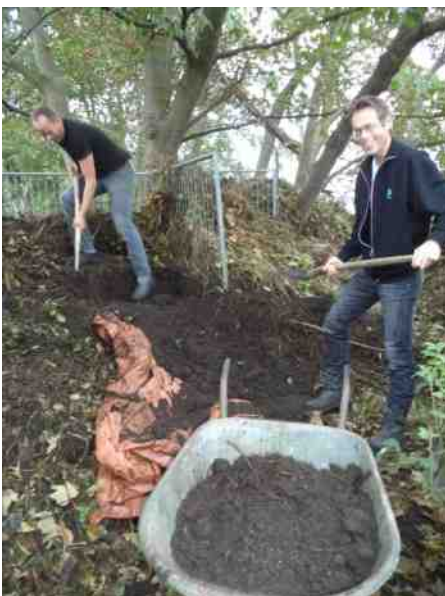
Algemeen Werk; afgraven composthoop