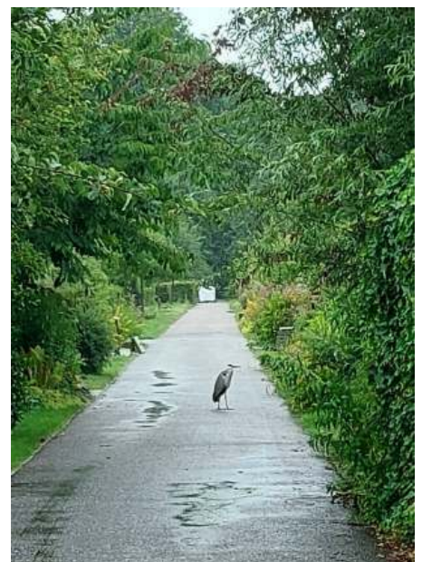
In juni regende het bij ZWN heeel hard. De slakken rukten op en de reiger wachtte af...