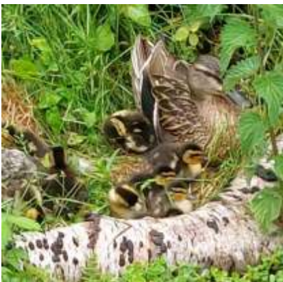
Moeder eend met haar kuikens