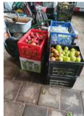
Fruit graag zo in de loods zetten