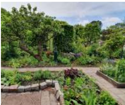
Volgens model van Jelle's makkelijke moestuin