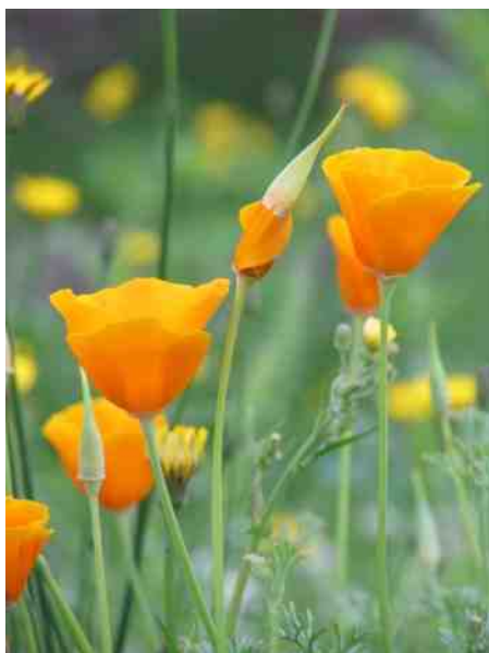
Slaapmuts wordt wakker

Een paar weken op vakantie geweest en het is een zootje! Waar zijn onze met veel zorg omringde planten gebleven? Een en al onkruid. Nee, toch niet; helemaal on-deraan zie ik een bekende!