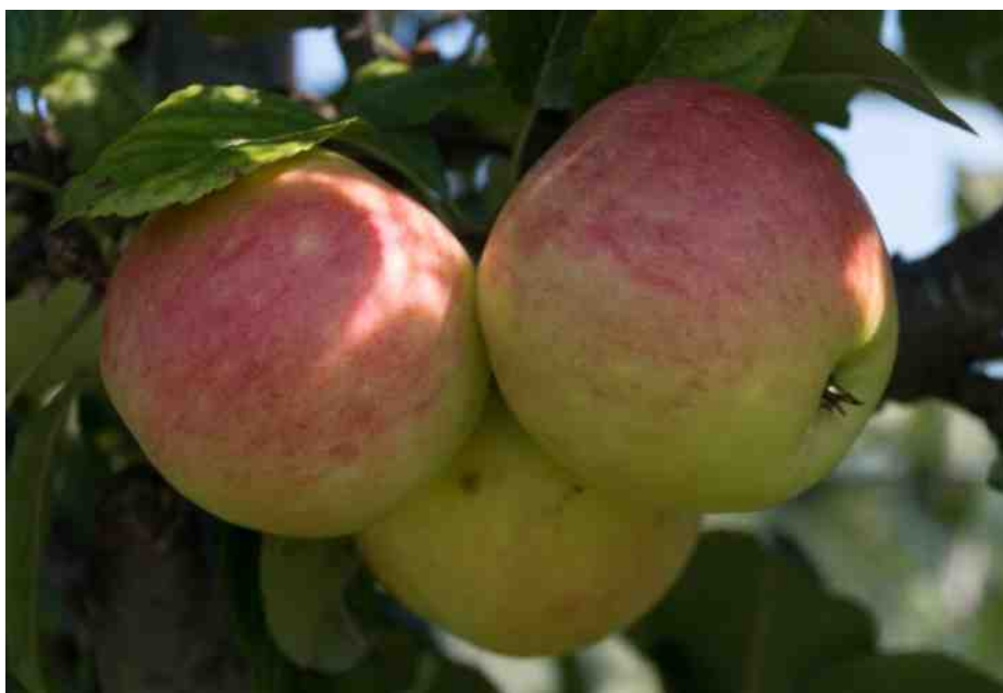
Mijn zomerappel 'James Grieve'