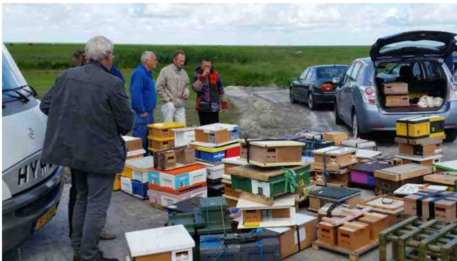
Maagdelijke koninginnen, geboren en ingepakt in de Benelux, klaar voor de oversteek naar Ameland