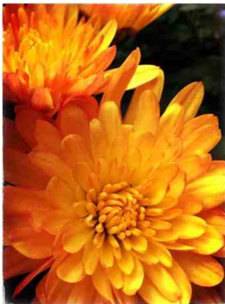
ZWN had een enthousiaste groep dahliakwekers die regelmatig in de prijzen vielen

Ten gevolge van het slechte weer is een grote jubileum bloementoon-