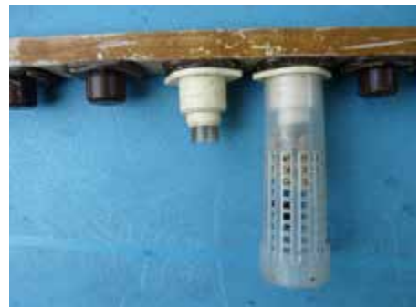
ingekooide nieuwe koningin die is geboren na omlarven