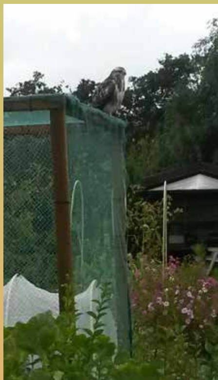
Diverse meldingen zijn binnengekomen over een buizerd, die laagscherend over de tuinen een rustplek zoekt. Wellicht is ZWN een van zijn jachtplekken en pauzeert hij na een maaltje jonge kat, muis of rat.

In de jaren zestig van de vorige eeuw was de Buizerd zeldzaam geworden door gebruik van pesticiden (landbouwbestrijdingsmiddelen). In Nederland komt hij nu algemeen voor, met een stabiele stand van ruim 10.000 broedparen.