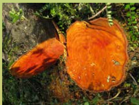
Wat ligt daar tussen het gras? Een paddenstoel? Het bleek een stomp van een afgezaagde boom op tuin M20. Prachtig! Mooier dan tropisch hardhout. Zie artikel hier naast. DS

Als je zelf iets ziet (planten, vogels, zoogdieren, insecten) of misschien zelf fotografeert, neem dan gerust eens contact op met Eef of met de redactie van de Tuinfluter.