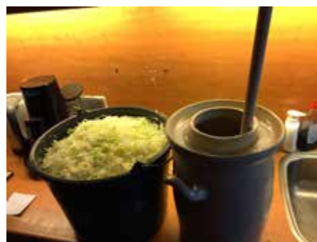
Zuurkoolpot met stamper