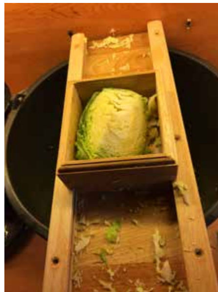
Berkenhouten koolschaaf in bedrijf