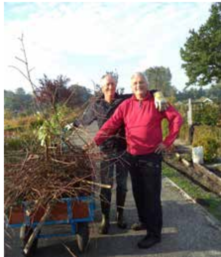
Algemeen Werk? Ik werk liever op m'n eigen tuin! Maar dan mis je wel de lol van het Samen Werken!